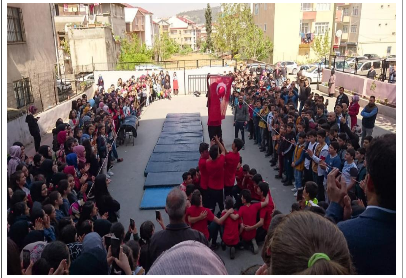
Okulumuzda 23 Nisan Ulusal Egemenlik Ve Çocuk Bayramından Bir Resim (2019)